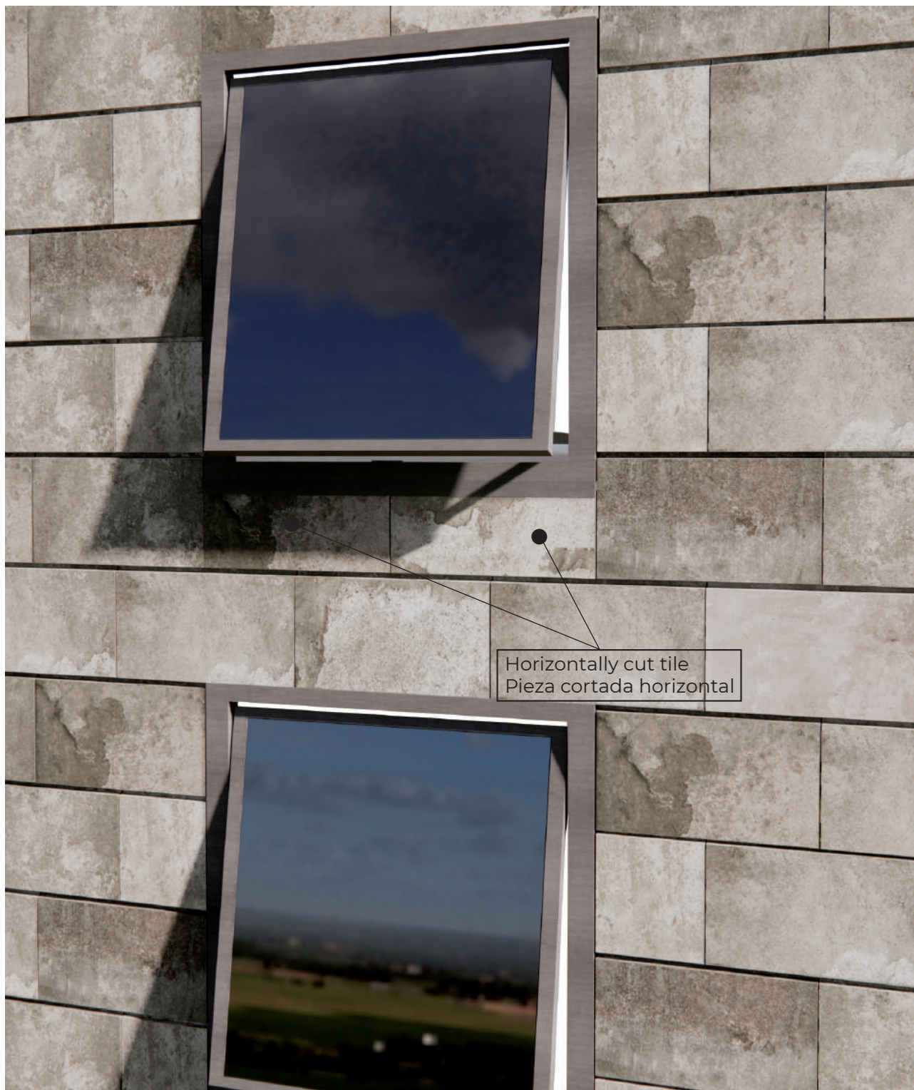
Window detail · Detalle ventana