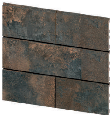
EK1027 Black Oxid