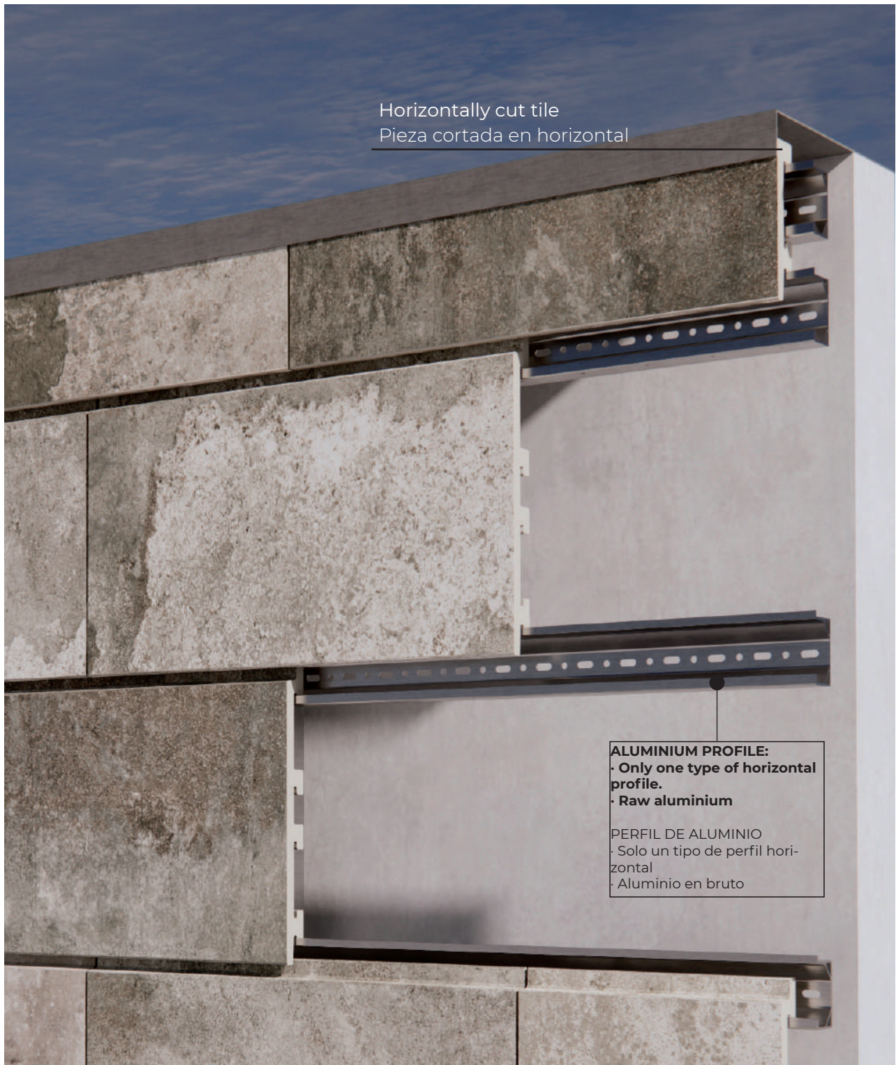
Top ending detail · Detalle remate superior