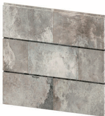
EK1024 Antique Moss