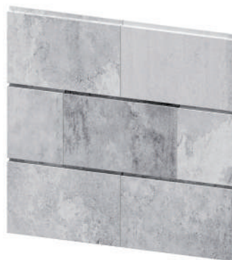
EK1023 Antique Grey