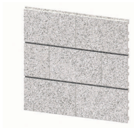
EK1059 White Granite